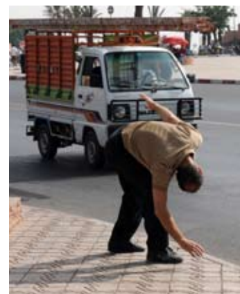
Trajets de Vie Trajets de Ville, Marrakech, Corée © Martine Derain