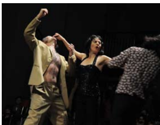
Salida, Par les Villages