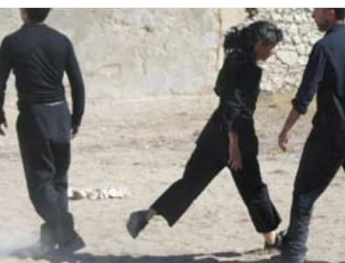
Quarantaine au Frioul