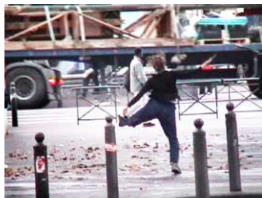
Passants à la Minoterie, Marseille Projets Passants dans les rues de Belsunce